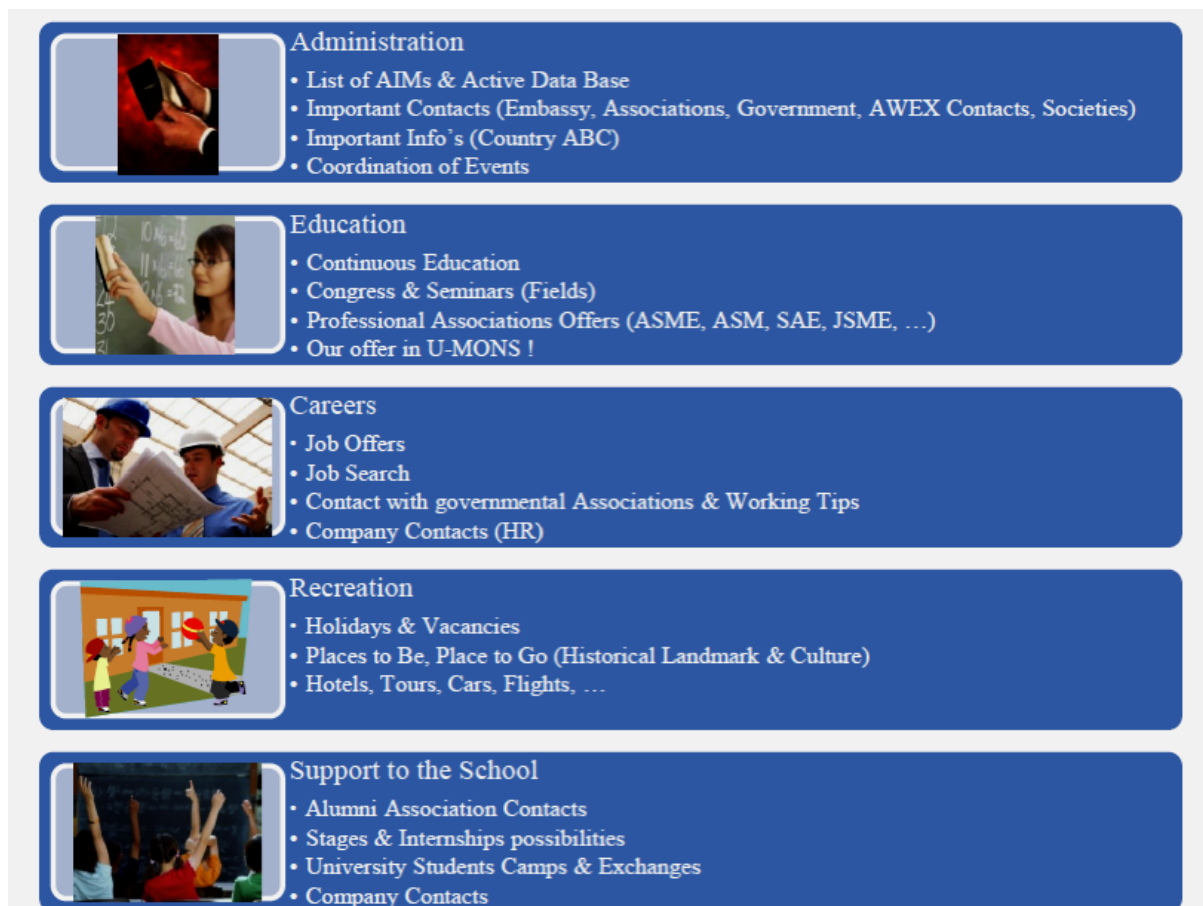
Tabella n°SI-1/2 : Tabella delle « Missioni di Base » o delle « Missioni locali principali »

Sono state così identificate 5 « missioni di base » :